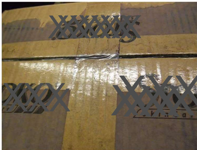
zu nah aufgenommen

Beispiele wie Bilder nicht aussehen sollten: