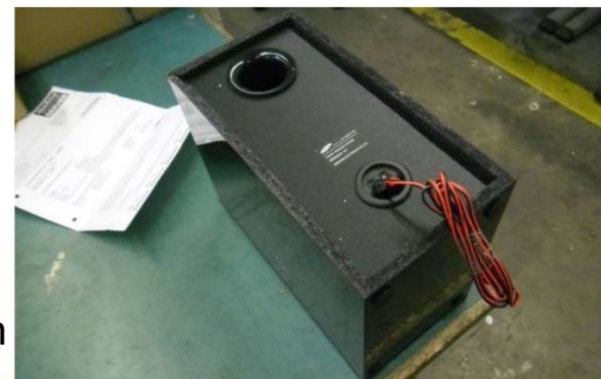
Auf diesem Bild ist kein Schaden zu erkennen →