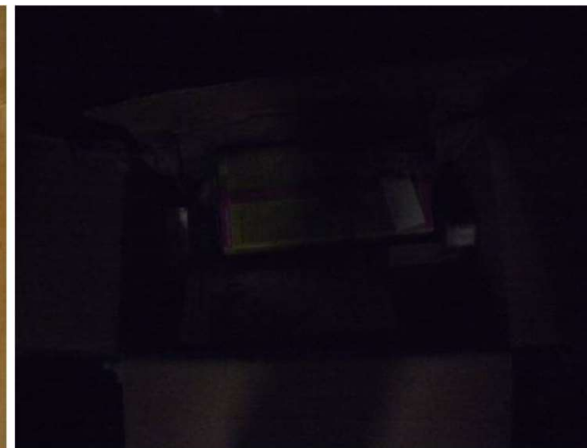
zu dunkel, nicht genug Licht im Raum