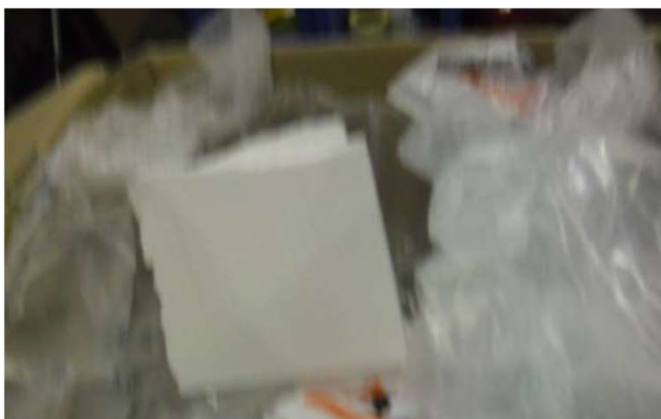
← Bild verwackelt, Kamera wurde nicht ruhig gehalten