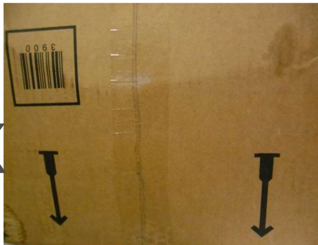
zu nah aufgenommen, Bild sagt nichts aus